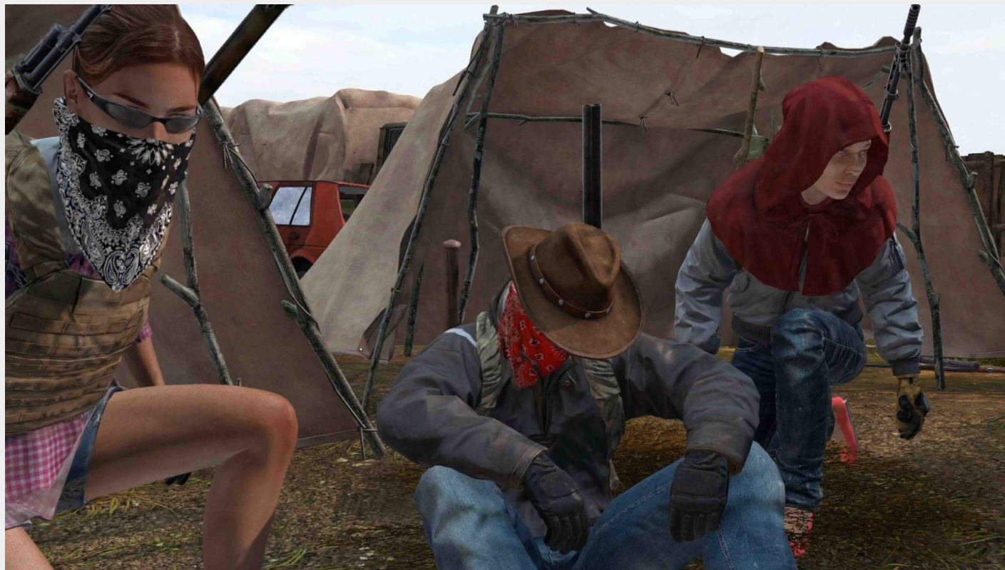
Knit's Island, próximo estreno internacional programado para febrero 2024