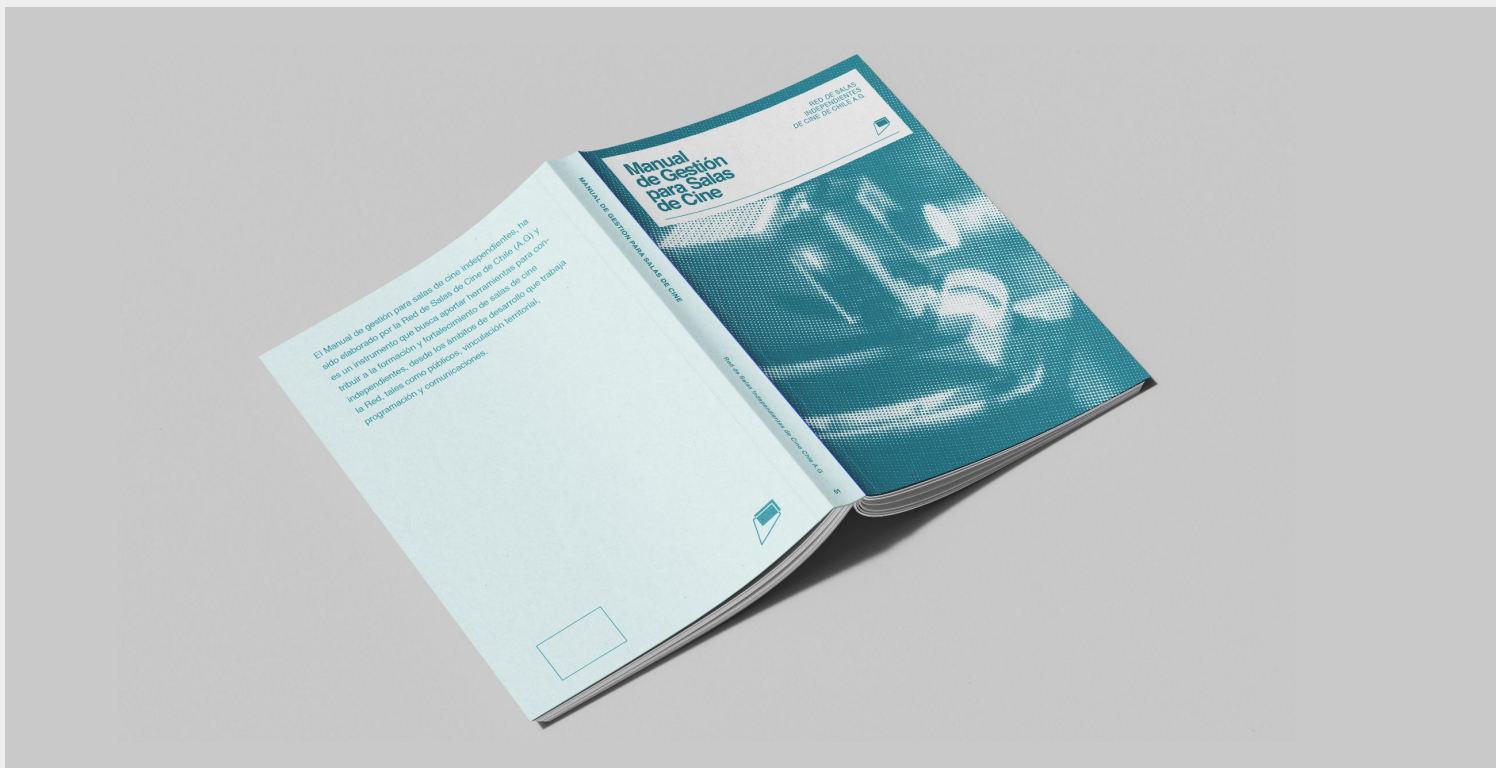
Portada del Manual de Gestión para Salas de Cine (2023)