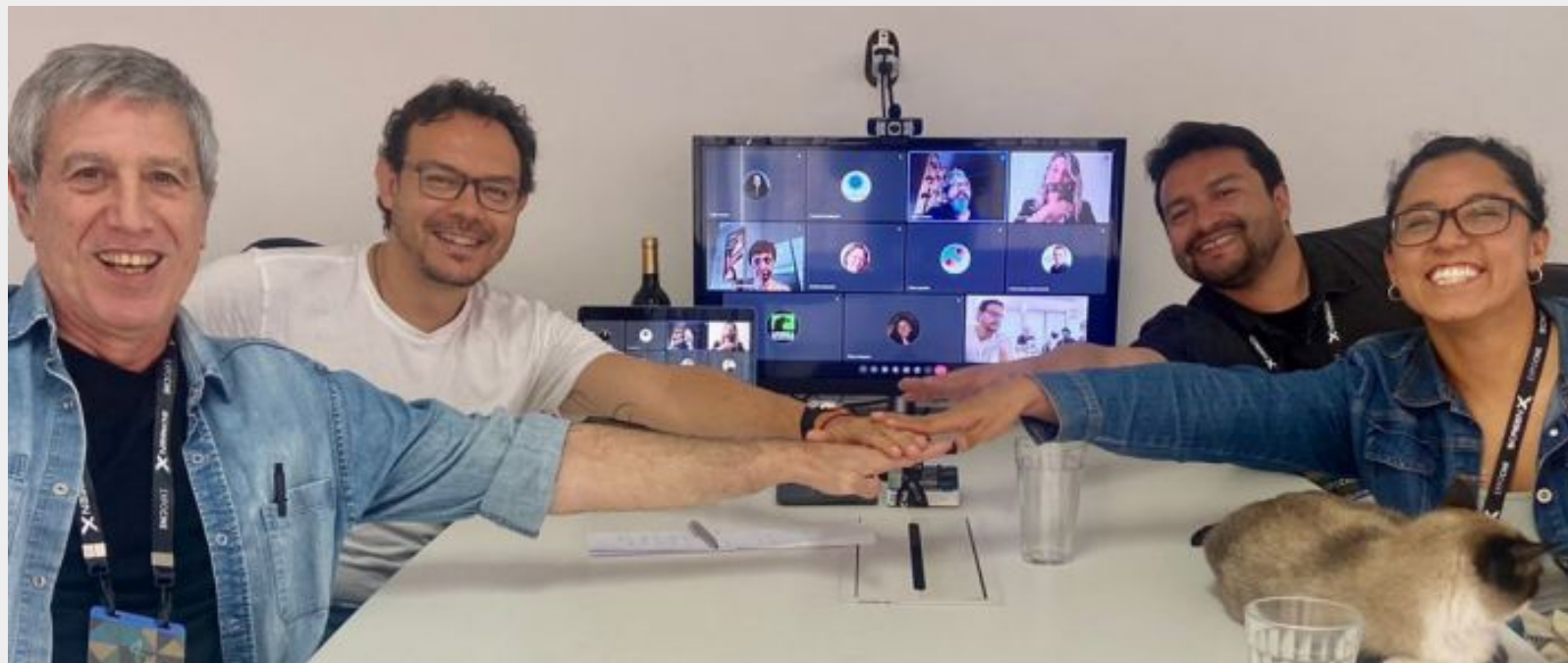
Firma de acuerdo de distribución de cine latinoamericano, Expocine Brasil 2023