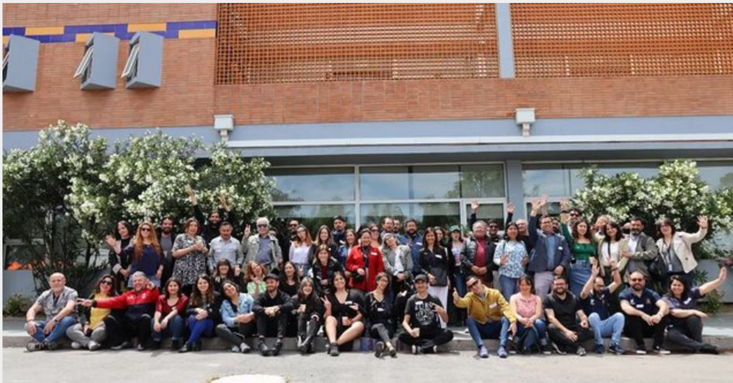
Encuentro macrozonal centro sur Red Cultura, Chiguayante