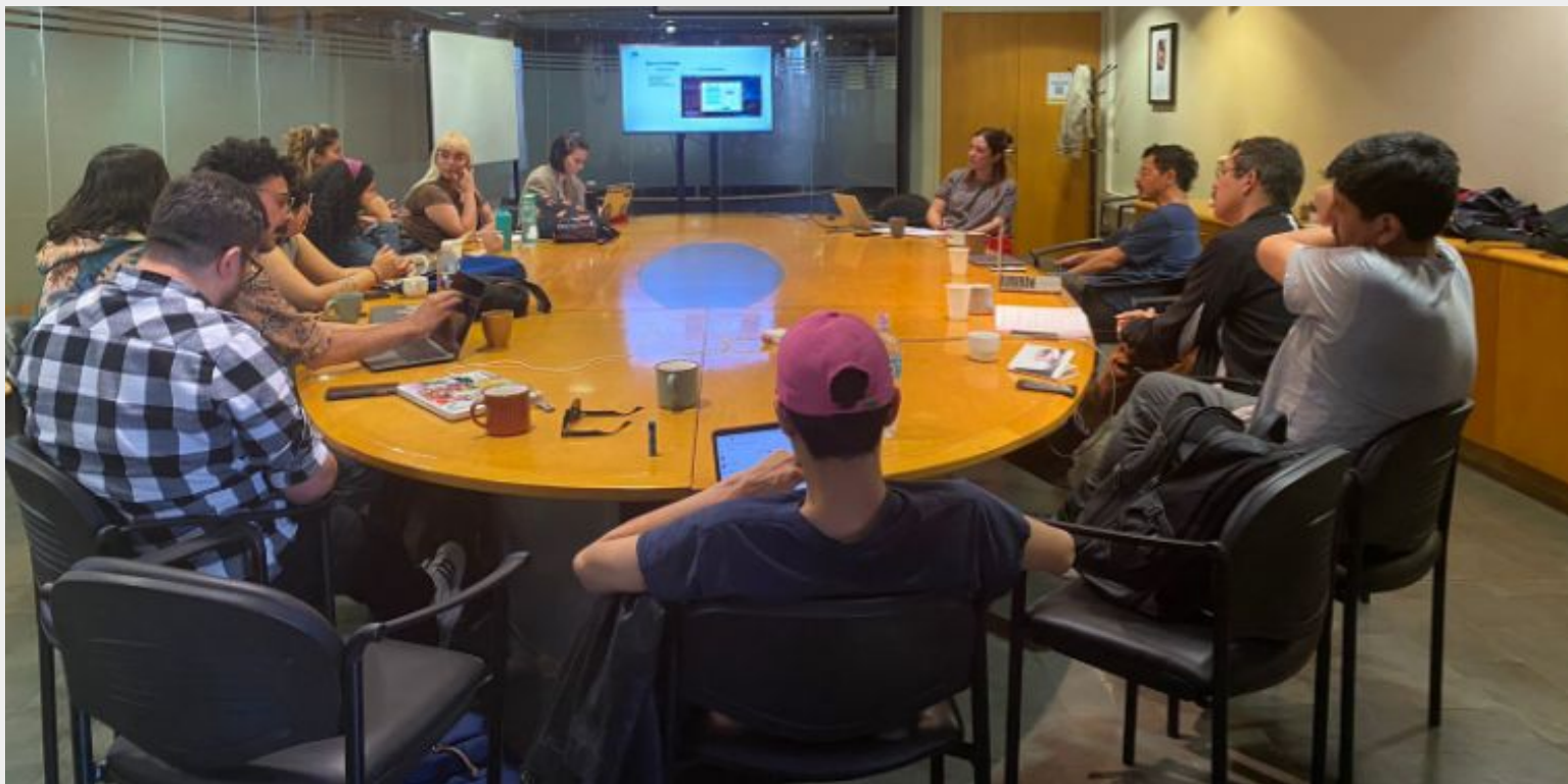
Reunión Industry Academy Australab, Santiago