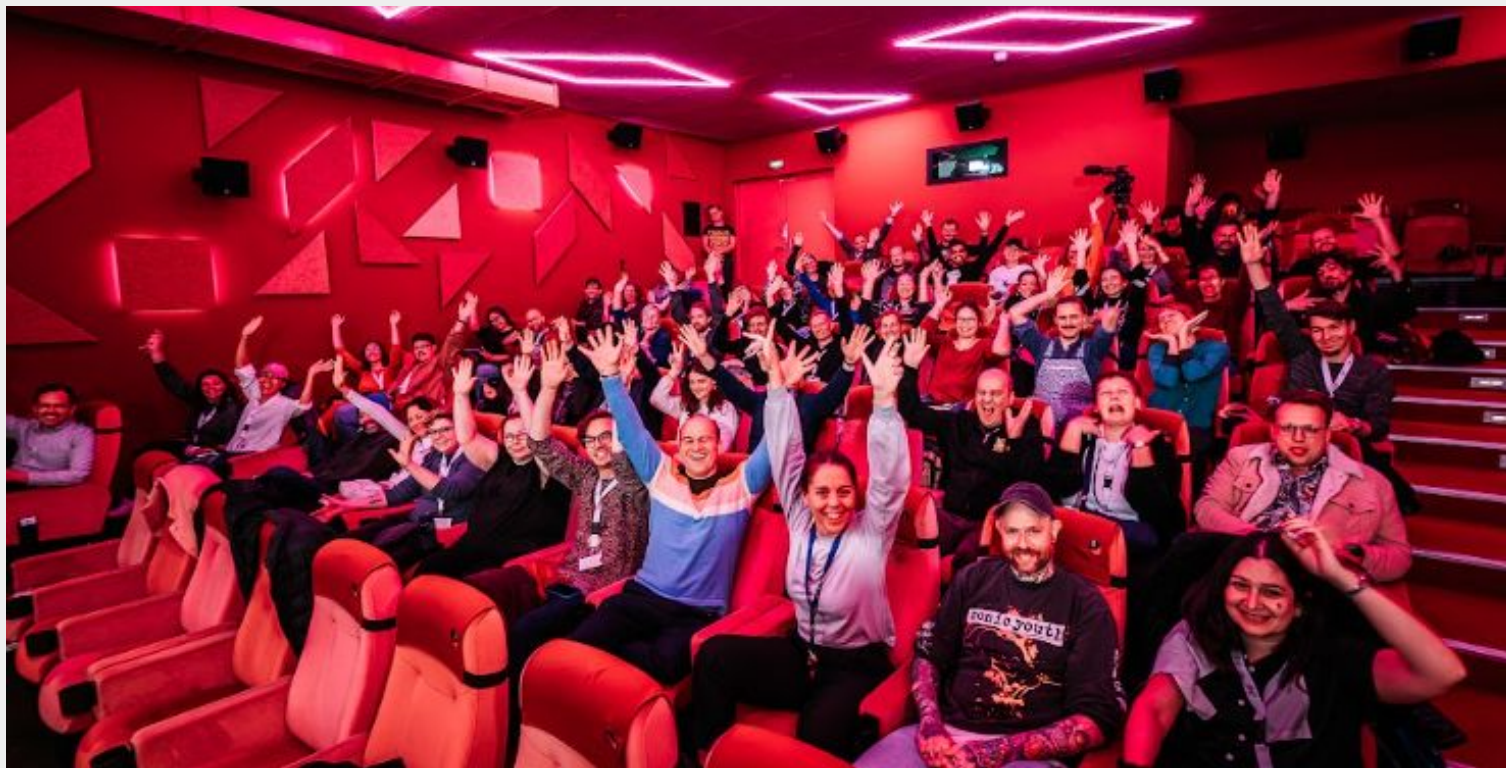
Arthouse Cinema Training CICAE, Berlín