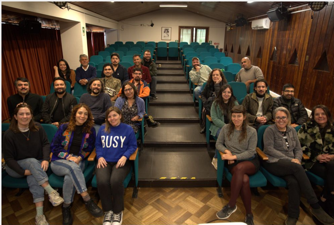
Asamblea presencial en Sala Mafalda Mora, Puerto Montt