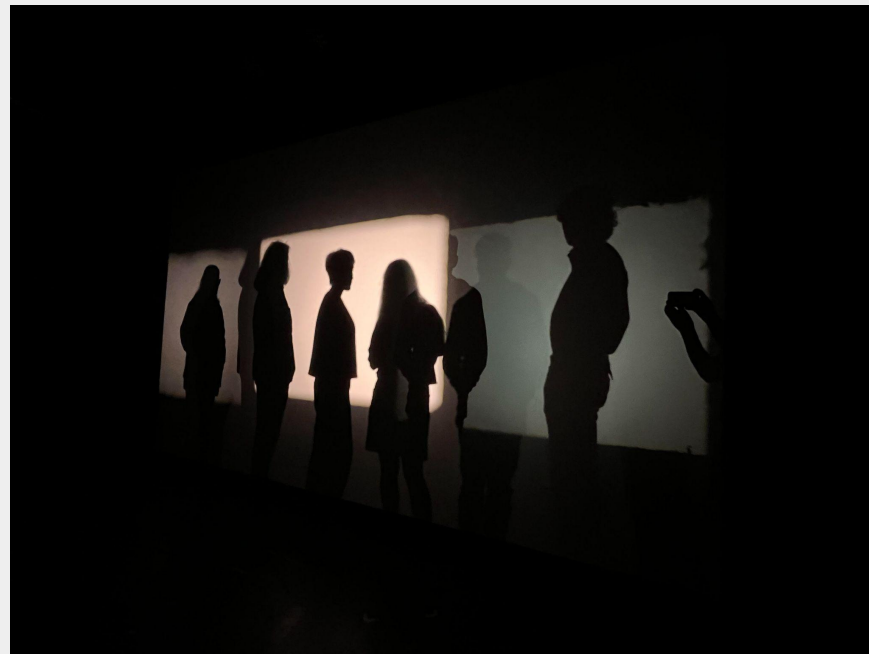
Fotos: Taller de cine sin cámara “Luz y Sombra”, guiado por CEIS8 en Centro Arte Alameda