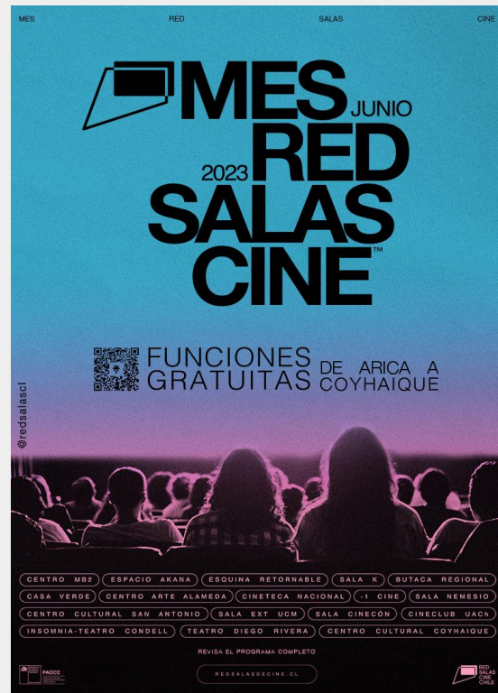
Inauguración Mes de la Red de Salas de Cine en Cineteca Nacional, Santiago