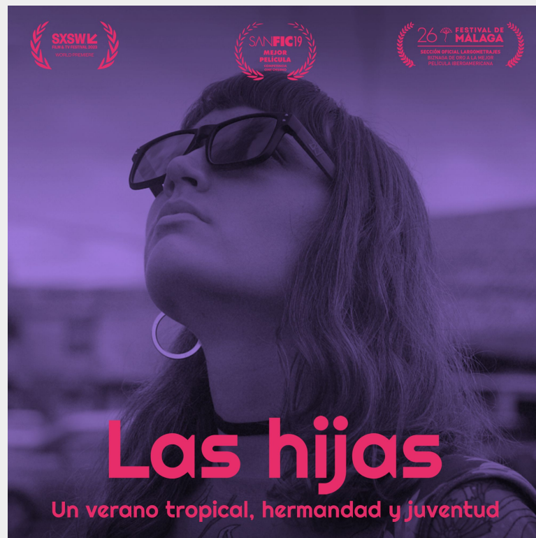
Gráficas desarrolladas para difusión Estrenos en Red 2023