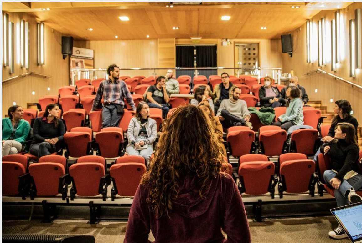
Focus Group en Trazar la Red en -1 Cine, Puerto Varas