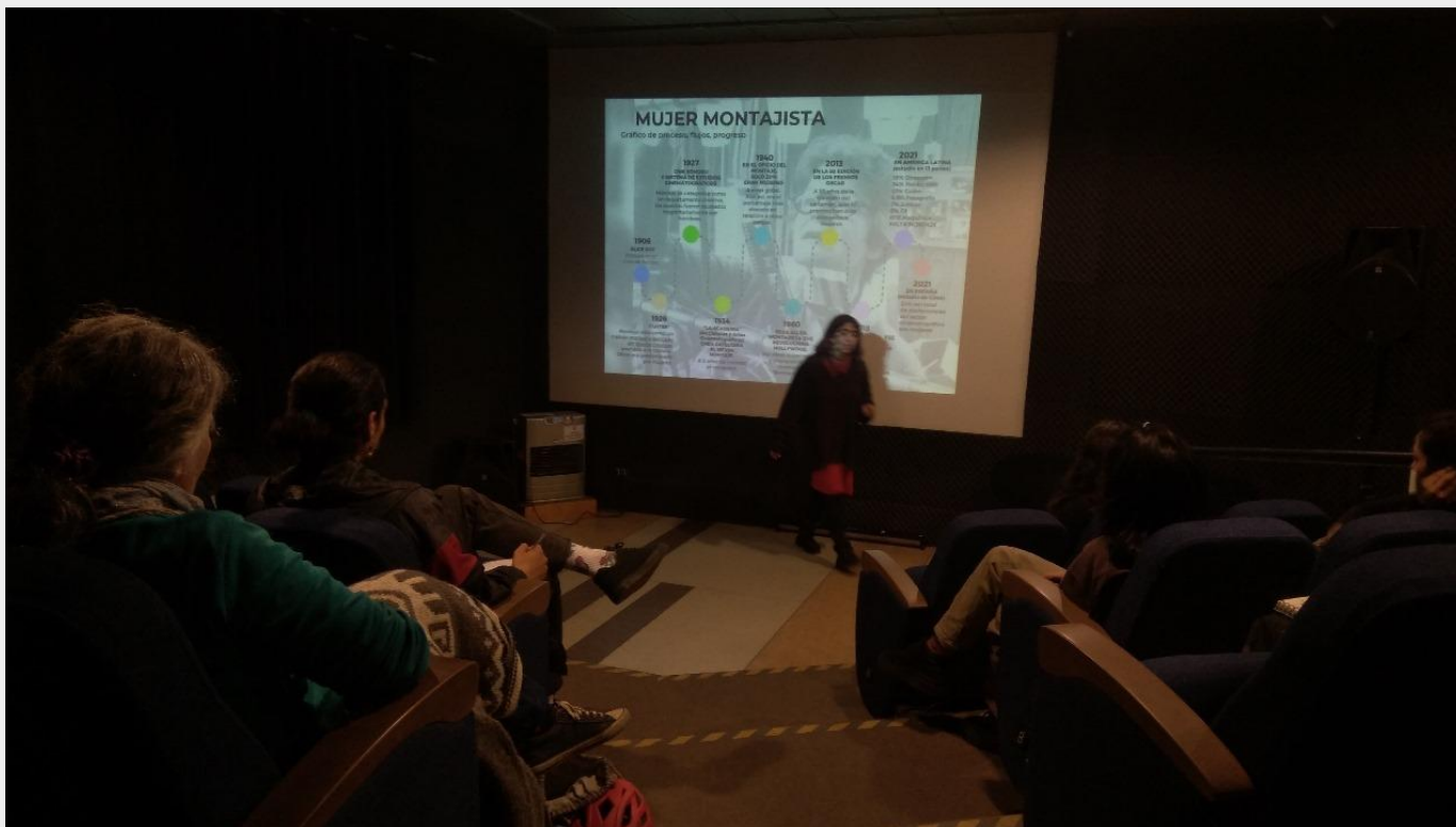
Taller “El lenguaje del Cine desde la mirada feminista“, Centro Cultural Coyhaique