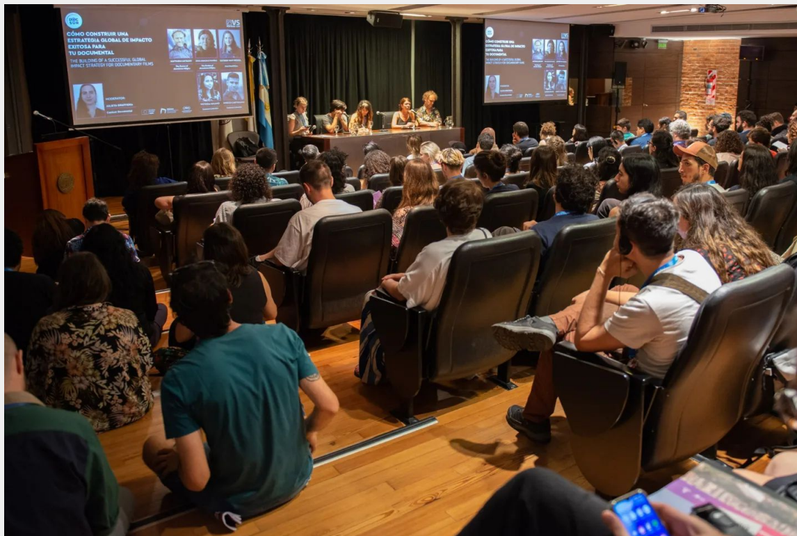
Jornada de trabajo en Ventana Sur 2023, Buenos Aires